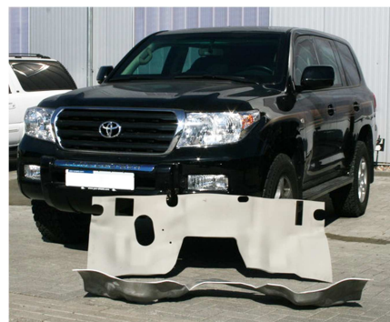
Deform varmformar och seghärdar pansarplåt. Här visas en torpedplåt till Toyota LC200.