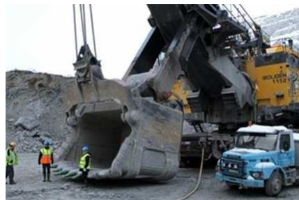
Deform varmformar och seghärdar plåt till gruvindustri, entreprenad – och anläggningsmaskiner. Vi tillverkar exempelvis slitplåtar till Bolidens P&H maskiner.