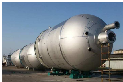
Deform tillverkar alla formade delar till tryckkärl. Här visas en komplett massakokare som levererats till kund i Sydafrika.