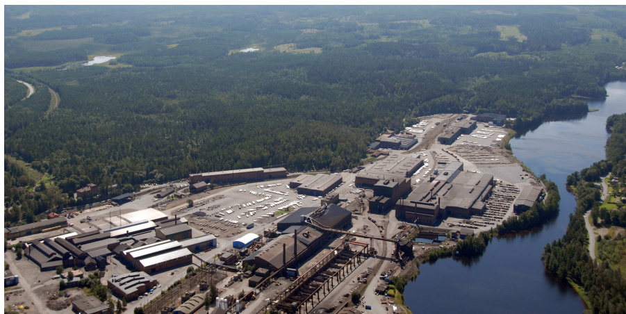
Deform vackert beläget intill naturreservatet Sveafallen.

Vi har idag en exportandel på över 70 % och vet att vi är konkurrenskraftiga världen över. Men vi är inte nöjda utan har ett mål att fortsätta växa kraftigt inom utvalda segment.